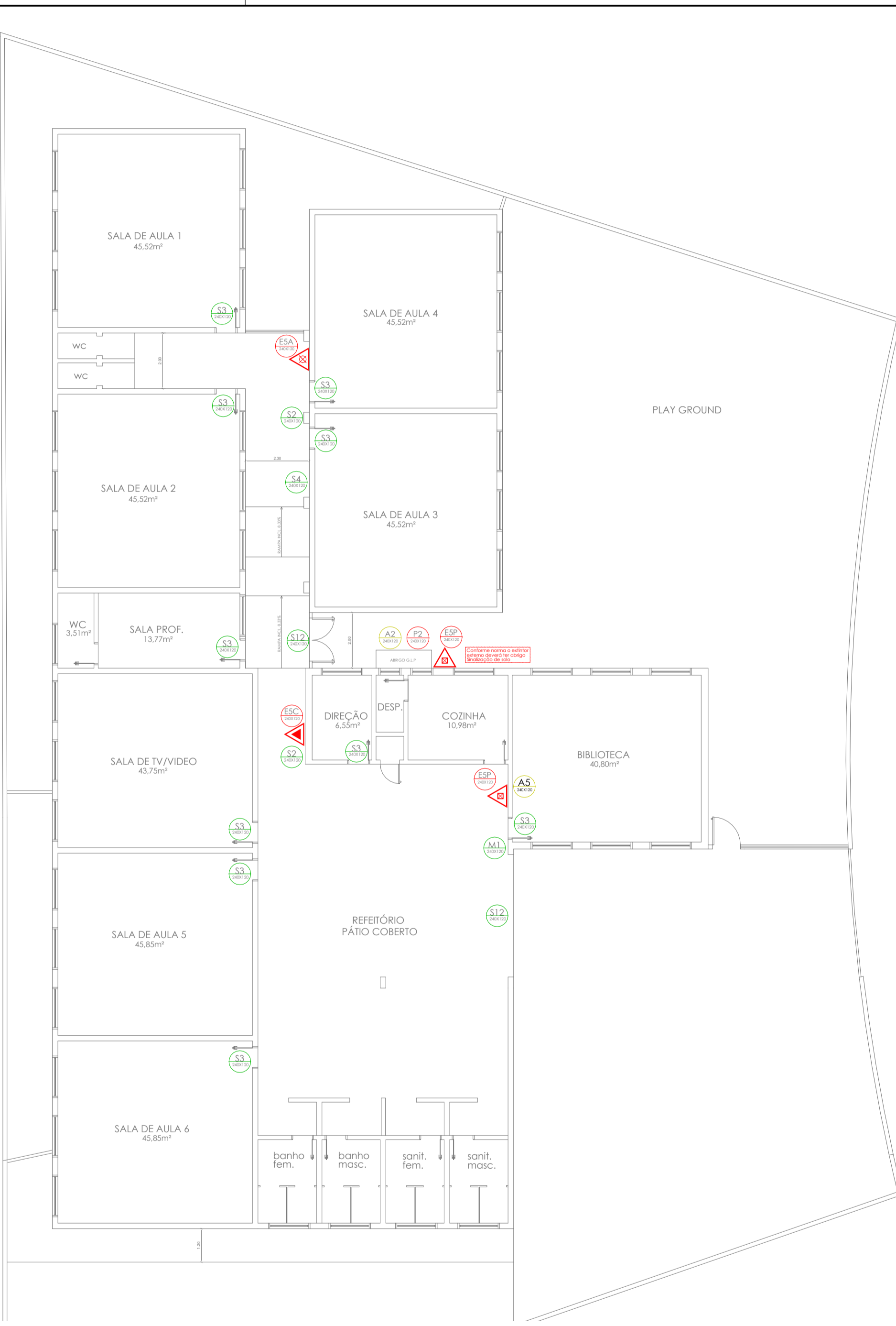
PLANTA TÉRREO ESC:1:100